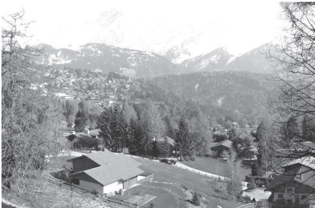
Vue de la région de Villars-sur-Ollon