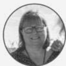
Ariane de Bourbon Parme